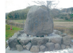
(事業竣工記念石碑)