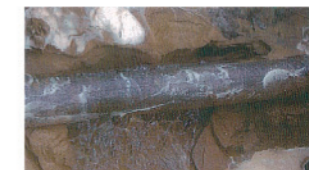
(パイプラインの漏水)